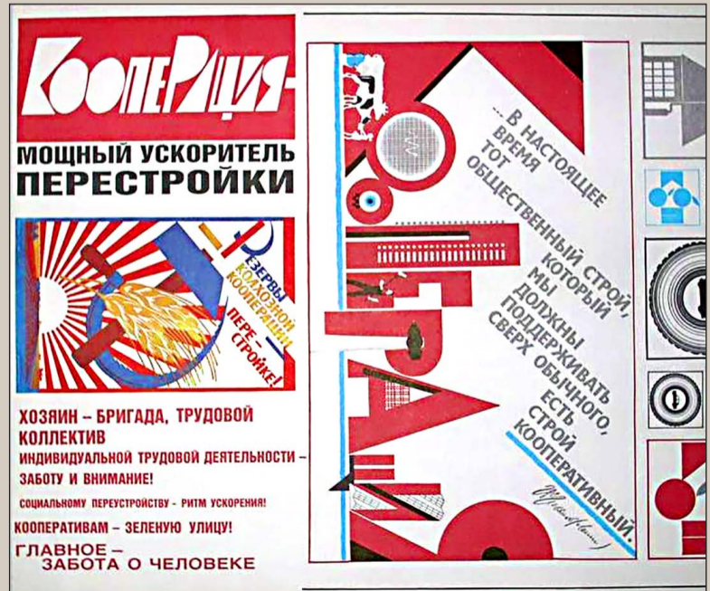
Оформительская агитационная стилистика времен перестройки 1980-х годов нарочито напоминает плакаты 1920-х, призывавшие население к кооперации

Попытавшись использовать опыт НЭПа во время перестройки, мы после краха СССР «латиноамериканизовали» страну (не случайно в 1990-х годах был так популярен «опыт» пиночетовского Чили) и в результате «упали» туда, куда другие пытались залезть.