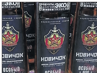
Пока что бренд «Новичок» только двигает торговлю в России

В Кремле, видимо, полагают, что осторожность Брюсселя объясняется демаршем министра иностранных дел Сергея Лаврова, предупредившего западных «партнеров» о жестком ответе на слишком «чувствительные для российской экономики» санкции. Действительно, в феврале обсуждалась возможность введения персональных санкций против большого числа российских предпринимателей.