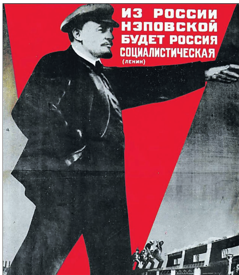
Плакат «Из России нэповской будет Россия социалистическая» (Ленин). Художник Густав Клуцис. Москва, Ленинград. «ИЗОГИЗ». 1930 год

Одним из самых значимых событий в отечественной истории было проведение новой экономической политики (НЭП) в 1921–1928 годах. Начиная с эпохи перестройки, историки активно изучают опыт НЭПа и пытаются найти в этой политике рыночные принципы.