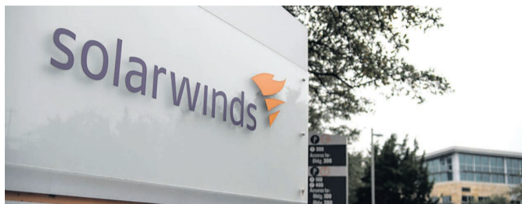
Штаб-квартира SolarWinds в Остине, штат Техас, США

Эти санкции введены после того, как президентская администрация обнародовала выводы разведки о том, что ФСБ, одна из ведущих спецслужб России, несет ответственность за отравление и заключение под стражу лидера российской оппозиции Алексея Навального.