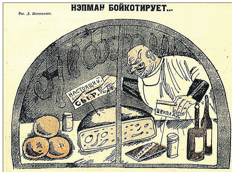
Карикатура из газеты времен НЭПа. Художник Д. Мельников.

Торговец: – По декрету я должен все эти товары бойкотировать. Зачеркну-ка «швей...». Батюшки, еще хуже стало! Надо все слово зачеркнуть. А ежели «сыр» оставить, все поймут, что он швейцарский. Сделаю-ка я вместо «сыр» – «СССР»!