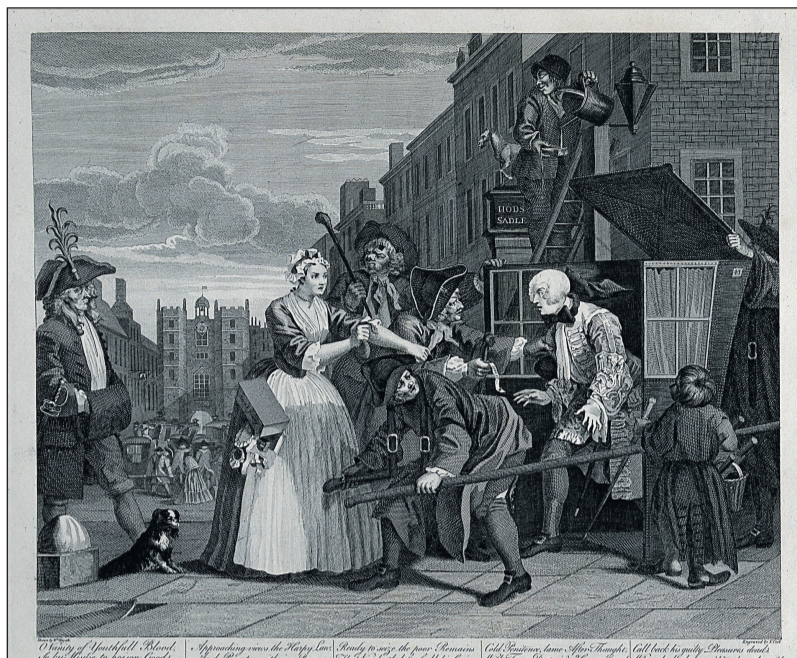
«Арест за долги». Гравюра Томаса Кука по рисунку Уильяма Хогарта из серии «Похождения повесы». 1796 г.

• наличие объективных препятствий, наличие которых не позволило должнику исполнить судебный акт с одновременной подачей ответчиком заявления о предоставлении отсрочки или расписки исполнения судебного акта;